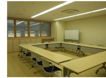
会議室(現地対策本部)