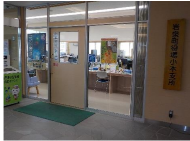
岩泉町役場小本支所